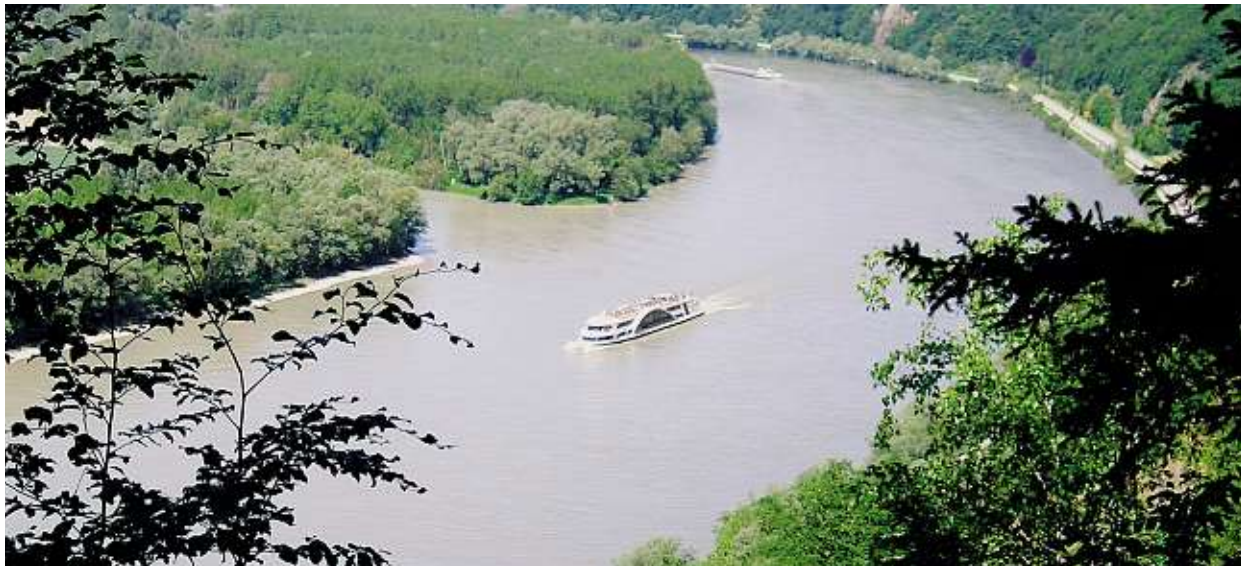
Donaublick bei Buchsee