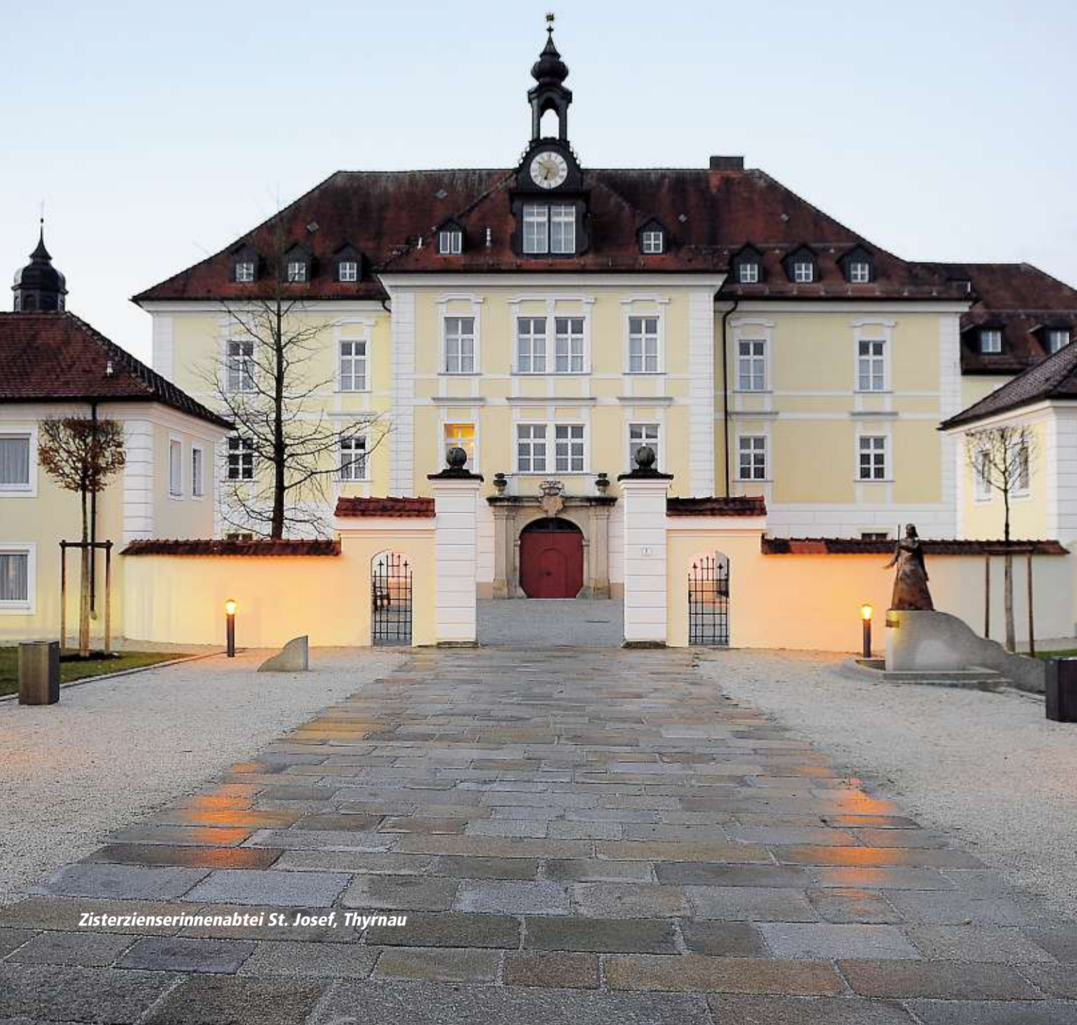
Zisterzienserinnenabtei St. Josef, Thyrnau