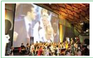
EM 2008 Großleinwand

PROFITIEREN AUCH SIE VON ÜBER 25 JAHREN ERFAHRUNG!