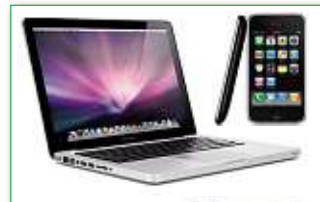
Apple Mac / iPod / iPhone