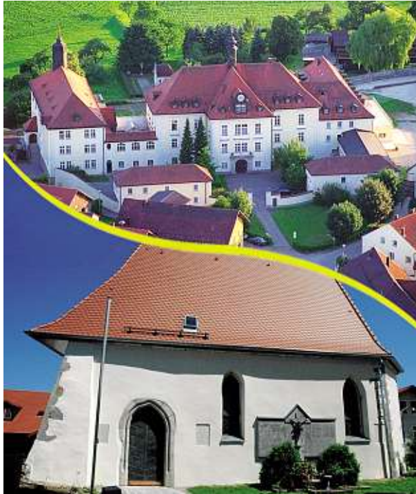
Kloster der Zisterzienserinnen-Abtei St. Josef (oben) Leonhardikapelle Kellberg (unten)